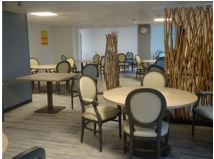
Notre belle salle à manger